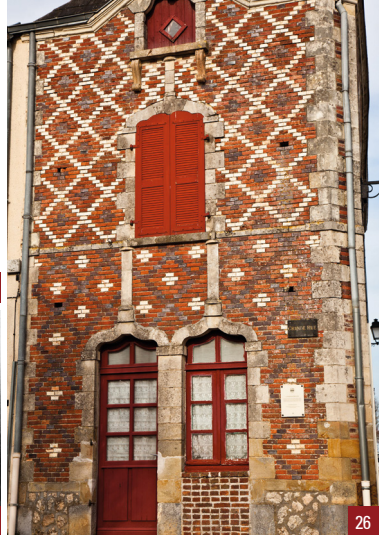
25. La fontaine / 26. La maison Faucheux / 27. La buanderie, à gauche, carte postale du début 20 e s.