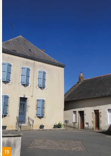
18. La Grande Maison / 19. La Cour Vassal / 20. La rue Creuse