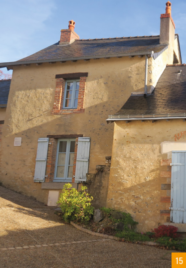
15. La maison de la Basse Forêt / 16. L'entrée des écuries / 17. L'auberge Lemoine, au premier plan à droite, début 20e s.