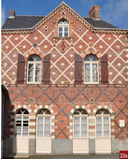
21. La maison néo-classique / 22a. Le café / 22b. Détail de la façade du café